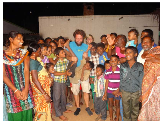
La fête avec les villages