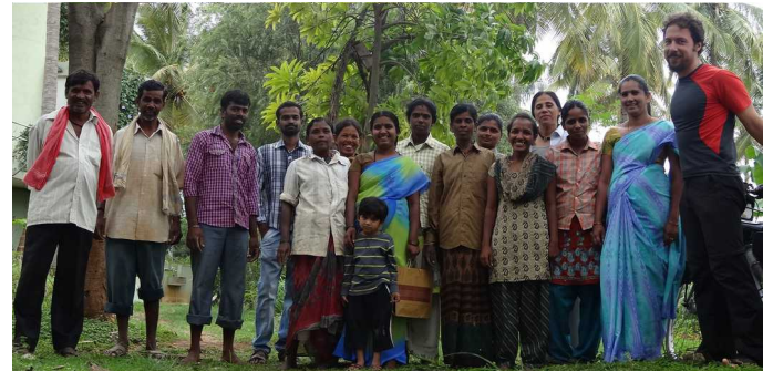
Les fermiers d'Annadana