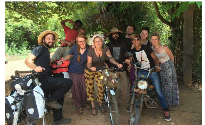
Les bénévoles de Sadhana