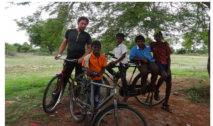
Les jeunes pousses de l'Inde