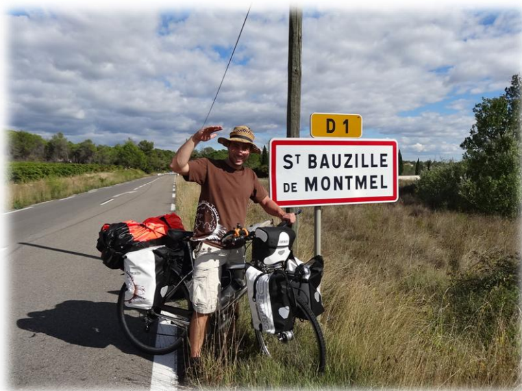
Mon départ à la sortie du village