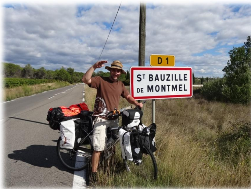
Mon départ à la sortie du village